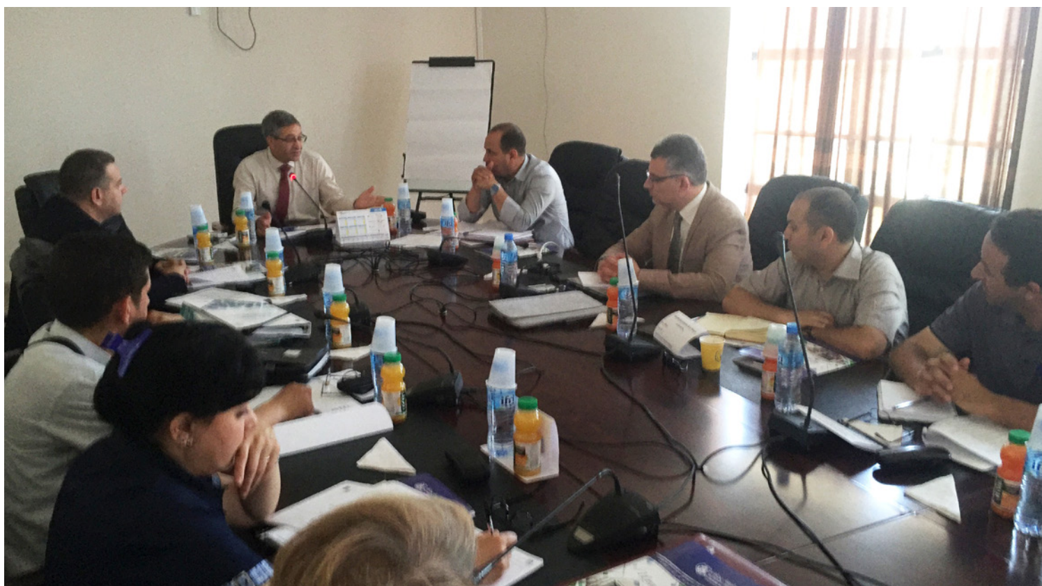
Table ronde organisée par le Bureau International du Travail à l'Université de Béjaia.