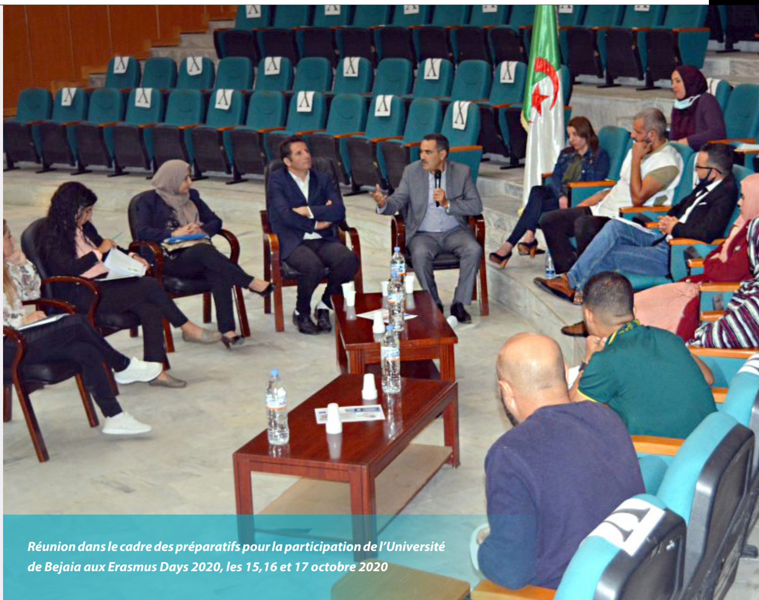
Réunion dans le cadre des préparatifs pour la participation de l'Université de Bejaia aux Erasmus Days 2020, les 15, 16 et 17 octobre 2020

rappel, ces projets versent dans l'innovation, le transfert de technologies et l'entrepreneuriat. Les travaux de célébration se sont poursuivis le deuxième jour avec deux projections de films. Une consistait en des témoignages sur les journées d'études sur le projet d'établissement et assurance qualité organisées dans le cadre du projet ESAGOV (l'Enseignement Supérieur Algérien à l'heure de la Gouvernance), l'autre comprenait un Meeting du focus group de l'Université de Béjaïa dans le cadre du projet CI-RES (Création de Capacités Institutionnelles d'Intégration des Réfugiés dans l'Enseignement Supérieur). Ce meeting, dont l'objectif est de mettre l'accent sur la problématique de l'intégration des étudiants réfugiés en mettant en avant les expériences des Etablissements de l'Enseignement Supérieur Algérien, a enregistré la participation de chercheurs, d'étudiants réfugiés, d'acteurs associatifs et des collectivités locales. Quant à la dernière journée, elle a été consacrée au projet EL@N (Modernisation de l'enseignement des langues dans