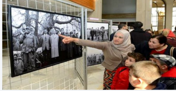
أعجب 5 ألف شخصًا بهذا . كن الأول بين أصدقائك.