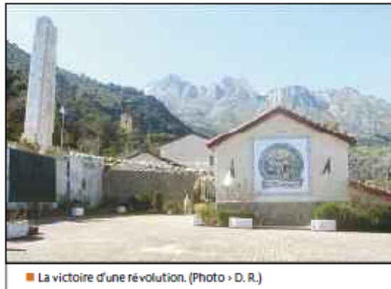
■ La victoire d'une révolution.

La seconde date, celle de la tenue du congrès de la Soummam en 1956, constitue un événement politique majeur dans la consolidation de la guerre de Libération nationale et la fondation de l'Etat algérien indépendant. Pour la commémoration de cet événement historique, le ministre des Moudjahidine, Tayeb Zitouni, a présidé, vendredi dernier à Béjaïa, les travaux de la première édition du colloque scientifique sur le congrès de la Soummam, où il a estimé que «la commémoration du double anniversaire des offensives du Nord constantinois (1955) et le congrès de la Soummam (1956) est une reconnaissance aux martyrs qui se sont sacrifiés pour recouvrer la souveraineté nationale», tout en précisant que «la région de Béjaïa a réuni des dirigeants venus des différentes régions du pays pour la libération de l'Algérie». «La commémoration du double anniver-