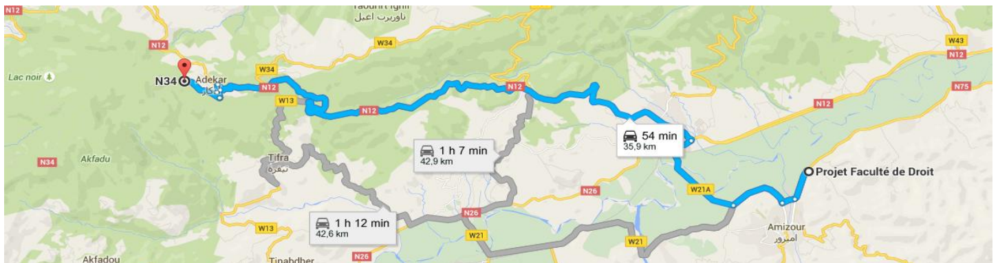
Itinéraire par bus: Amizour- Adekar