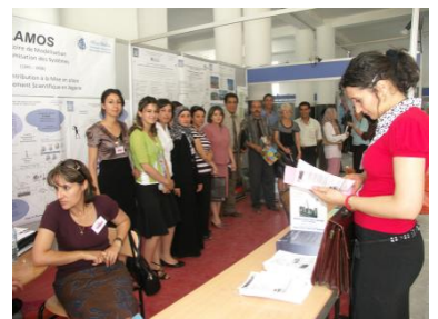
Le Stand du LAMOS au Forum Universités – Industries (Juillet 2008).

Le LaMOS a pour compétence le développement et l'application des méthodes de calcul scientifique et technique aux problèmes de modélisation, simulation et optimisation des systèmes complexes (notamment industriels et socio-économiques). Il est principalement constitué de 09 équipes et 02 groupes spécialisés :