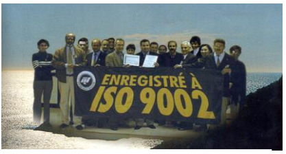
Le LAMOS a participé à la certification du port de Béjaïa