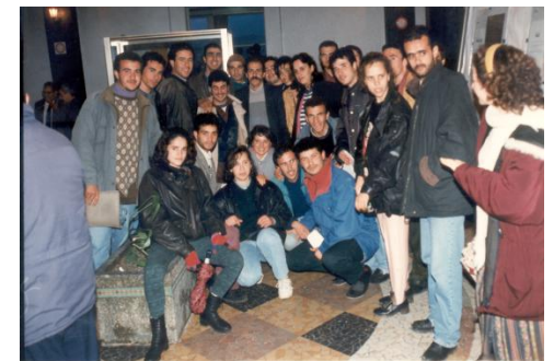
Les étudiants de Recherche Opérationnelle lors d'une activité du Laboratoire LAMOS en 1996