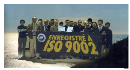
Le LAMOS a participé à la certification du port de Béjaïa