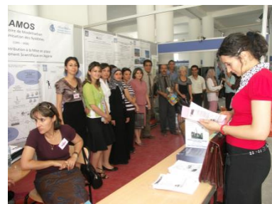
Le Stand du LAMOS au Forum Universités – Industries (Juillet 2008).

Le LaMOS a pour compétence le développement et l'application des méthodes de calcul scientifique et technique aux problèmes de modélisation, simulation et optimisation des systèmes complexes (notamment industriels et socio-économiques). Il est principalement constitué de 09 équipes et 02 groupes spécialisés :