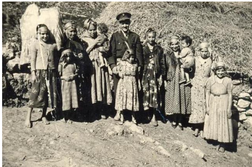
Figure 09 : Le Commandant Kaci rendant visite à la famille de Zighout Youcef en 1957

Mais l'action la plus symbolique figure sur la fameuse photographie le montrant en visite à la famille de Zighout Youcef en 1957. Rappelons que Zighout Youcef avait été un des promoteurs du Congrès de la Soummam qui avait mis définitivement en place les structures organiques et politiques de la Révolution de novembre. Nommé membre du CNRA, il avait été élevé au grade de Colonel de l'ALN et confirmé comme commandant de la Wilaya II. Malheureusement, il mourra à Sidi Mezghiche (Wilaya de Skikda) le 25 septembre 1956 dans un accrochage avec l'armée française.