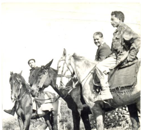
Figure 03 : Avec Krim Belkacem et Ben Tobbal dans le Maquis de Kabylie lors de la préparation du Congrès de la Soummam (Août 1956)