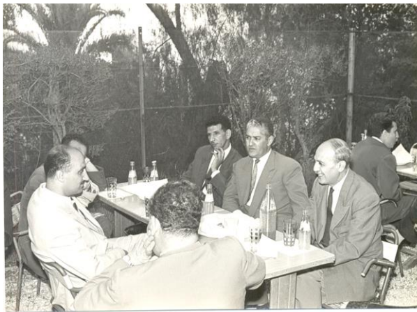
Figure 20 : Le Commandant Kaci en compagnie du Commandant Abderrahmane Mira à Tunis, avant son retour en Kabylie