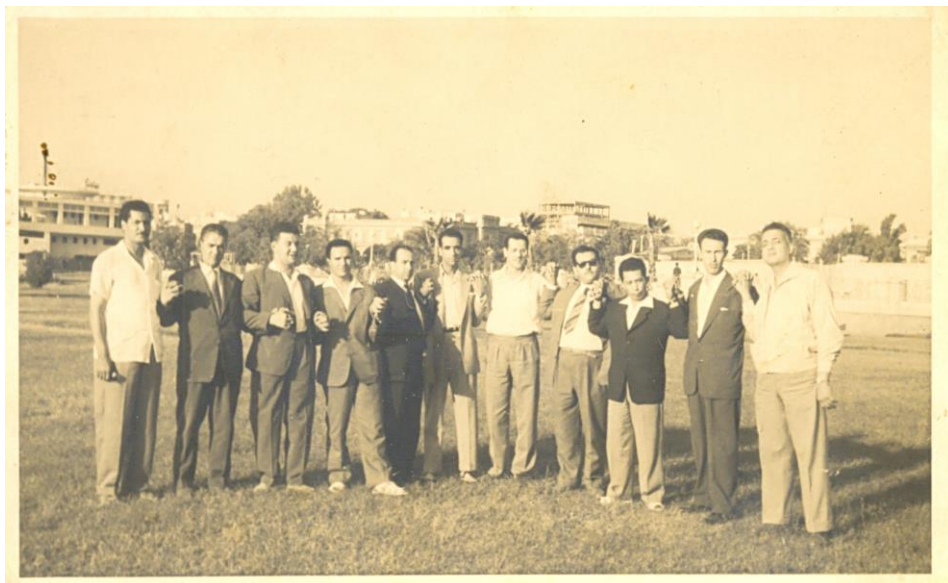
Figure 27 :En 1958 à la Conférence de Casablanca, en compagnie de Boussouf, Boumedienne, Krim, Ben Tobbal,...