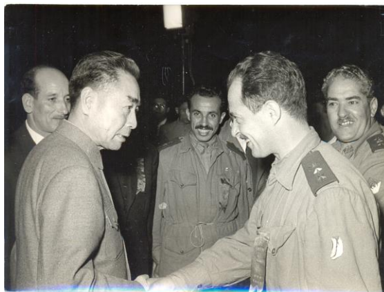
Figure 29 : Le Commandant Kaci à Pékin, en compagnie du Premier Ministre Chinois Chou en Lai et du Chef de Délégation, le Commandant Omar Oussedik