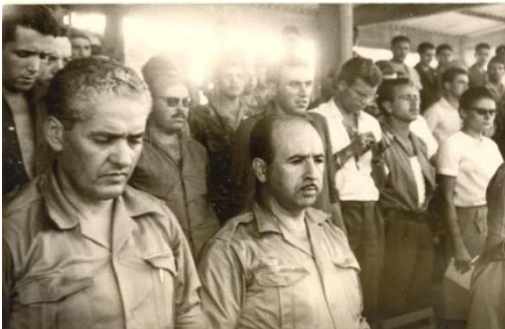
Figure 31 : Le Commandant Kaci et Krim Belkacem à Béjaia le 03 juillet 1962.

Après la signature des accords d'Evian en Mars 1962 par le GPRA, il participe à la mise en œuvre des dispositions et des résolutions des accords de cessez le feu, puis à l'indépendance en juillet 1962, il rentre en Algérie pour bâtir les fondements de l'Etat Algérien. Sur les photographies, on voit le Commandant Kaci en compagnie de Krim Belkacem et de Mohand Oulhadj à Béjaia le 03 juillet 1962.