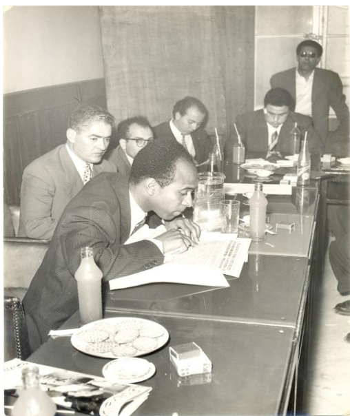
Figure 22 : Conférence de presse à Tunis pour donner des explications suite aux événements « de Mellouza ». Le Commandant Kaci en compagnie de Franz Fanon.