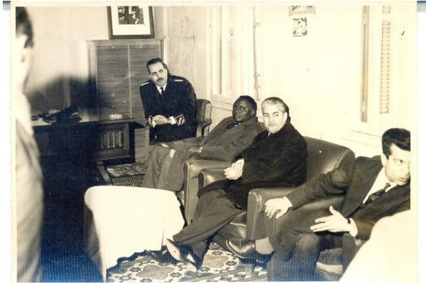
Figure 25 : Le Commandant Kaci en compagnie du Président guinéen Ahmed Sekou Touré, alors en visite officielle en Tunisie