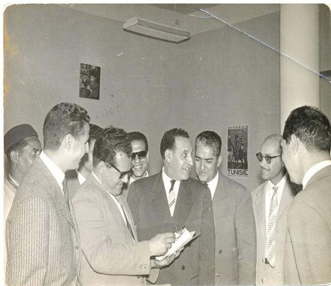
Figure 14 : Le Commandant Kaci en compagnie du président Ferhat Abbas et de Mouloud Gaid à Tunis