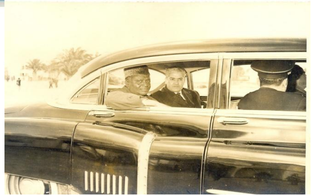
Figure 26 : Le Commandant Kaci en compagnie du Président guinéen Ahmed Sékou Touré, alors en visite officielle en Tunisie