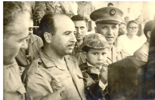
Figure 32 : Le Commandant Kaci à Béjaia le 03 juillet 1962. On reconnaît Krim Belkacem et le Colonel Mohand Oulhadj