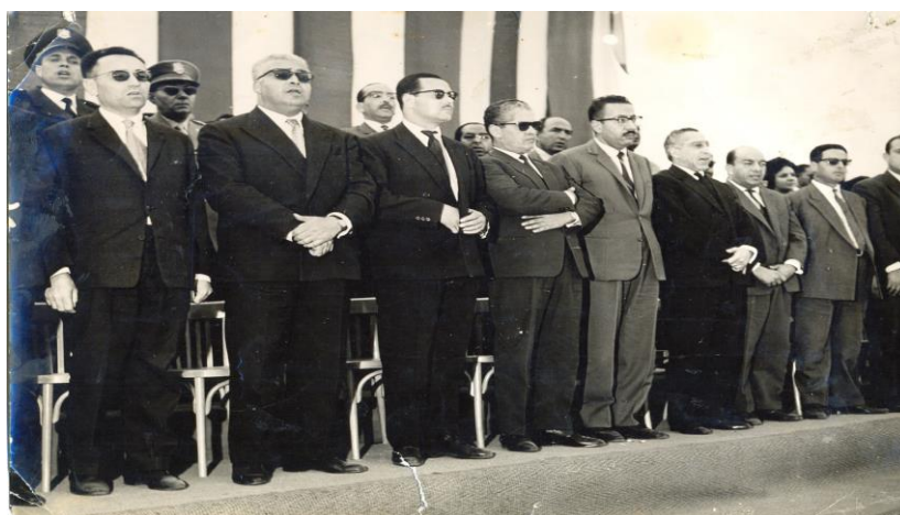
Figure 24 : A Tunis lors de l'installation du 2 ème G.P.R.A. On reconnaît le président Ben Khedda, M'hamed Yazid

La position au sein des instances politiques fait qu'il occupe une place protocolaire importante. On le voit ainsi accompagnant le Président guinéen Ahmed Sékou Touré, lors de sa visite officielle en Tunisie, ou bien lors de l'installation du 2 ème G.P.R.A. On reconnaît le président Ben Khedda, M'hamed Yazid,