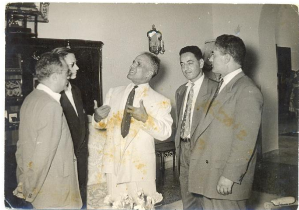
Figure 13 : Le Commandant Kaci en compagnie du président Bourguiba.