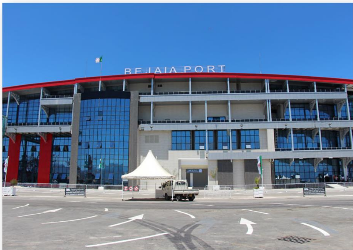
Gare maritime de l'EPB