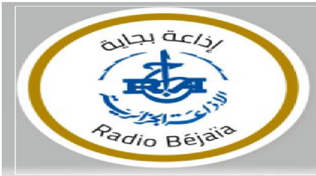
Figure07 : le logo de la radio Soummam de Bejaia