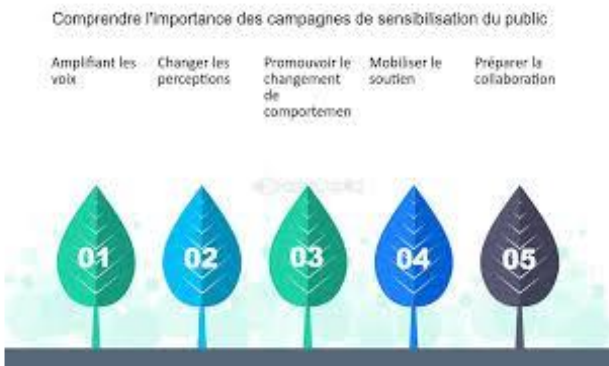
Figure 01 : comprendre l'importance des campagnes de sensibilisation du public (campions De sensibilisation du public diffusé des connaissances sur PA)

Les campagnes de sensibilisation jouent un rôle crucial dans la sensibilisation et la diffusion des informations aux multiples questions qui affectent la société, ces campagnes consistent changer les attitudes, des comportements, à éduquer le public, et provoquer un changement social positif.