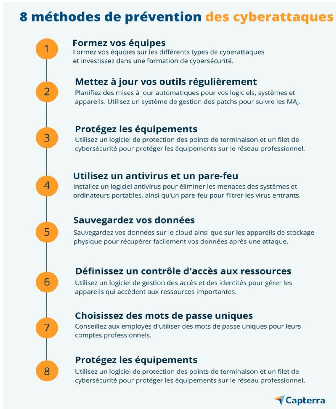
figure06 : 08 méthodes de prévention des cyberattaques