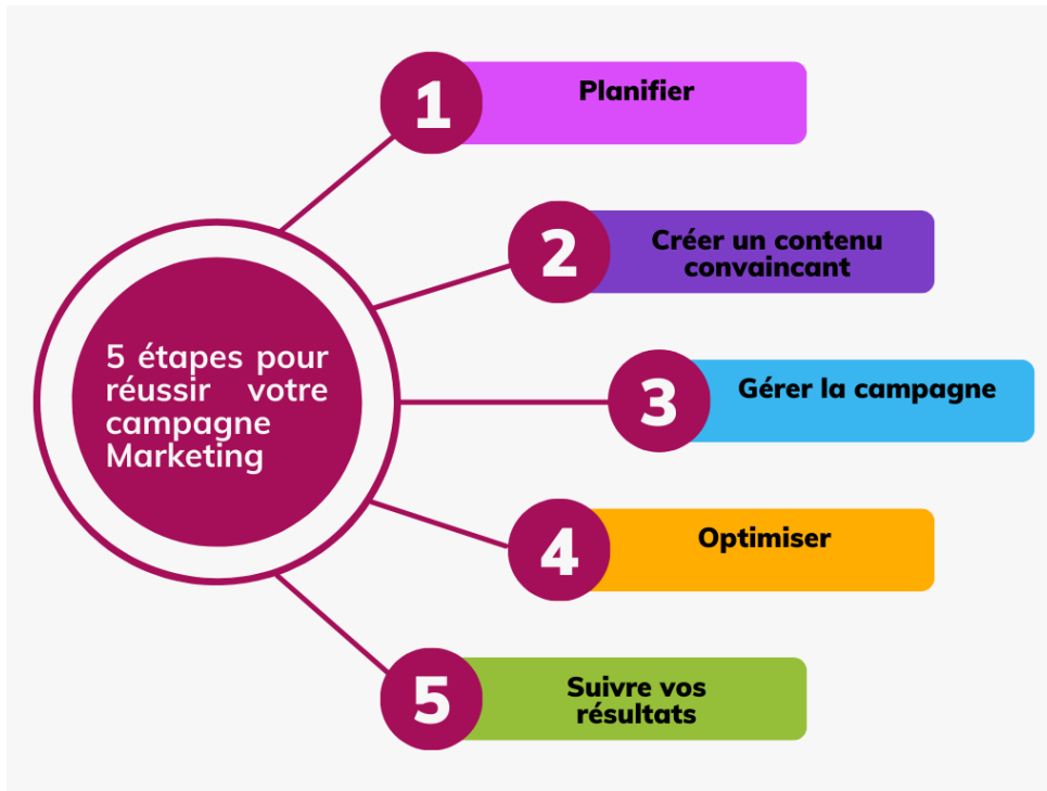
Figure 02 : les 05 étapes pour réussir votre campagne marketing (Campions de sensibilisation du public diffusé des connaissances sur PA)