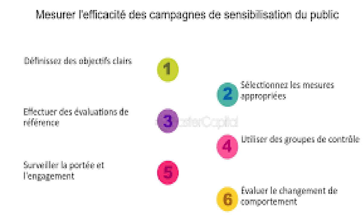
Figure 04 : mesurer l'efficacité des campagnes de sensibilisation su public (campions de sensibilisation du public diffusé des connaissances sur PA)